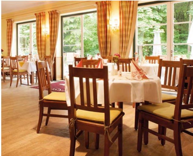
Restaurant mit Terrassenbereich

hell und gemütlich, sonnig auf der Terrasse