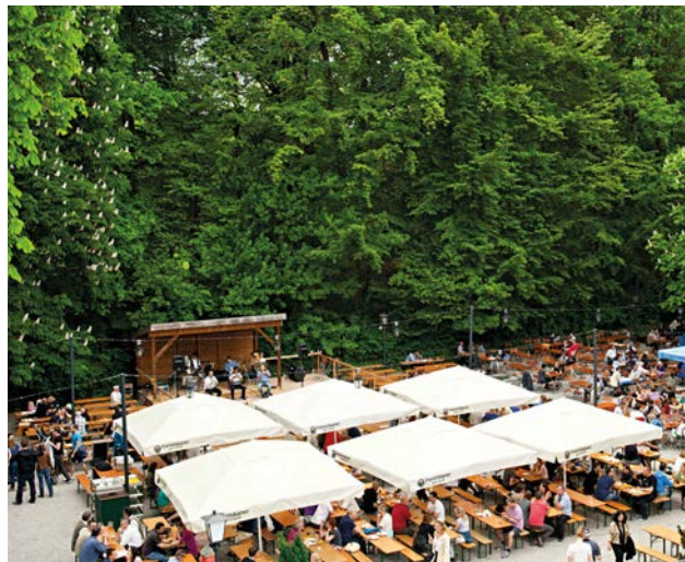
Biergarten mit Bühne und großem Abenteuerspielplatz

Das aktuelle Musik-Programm finden Sie auf unserer Website www.hirschau-muenchen.de .